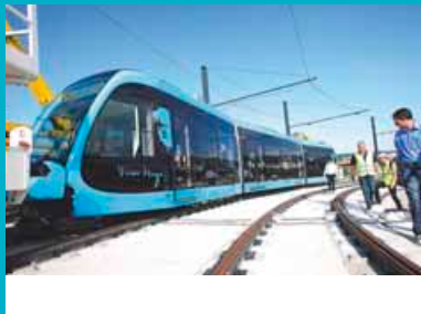
6 juin 2013: livraison de la première des 19 rames du tram.