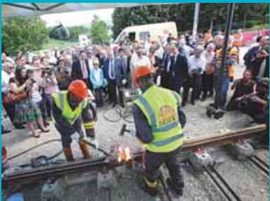
22 juin 2012: soudure des premiers rails.