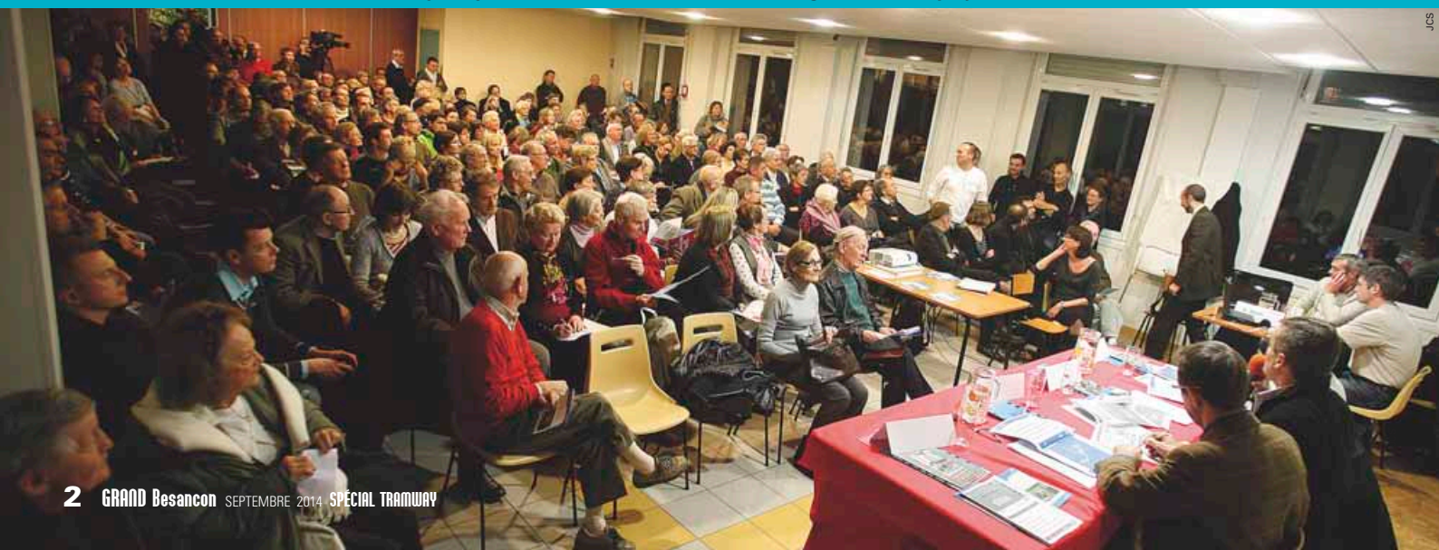
Décembre 2011: une des 180 réunions publiques de concertation et d'information organisées sur le projet et les travaux.