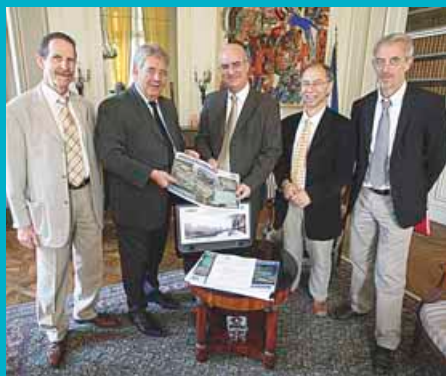
9 juillet 2010: dépôt du dossier de déclaration d'utilité publique en Préfecture.