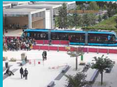
16 septembre 2013: premier essai du tram aux Hauts du Chazal.