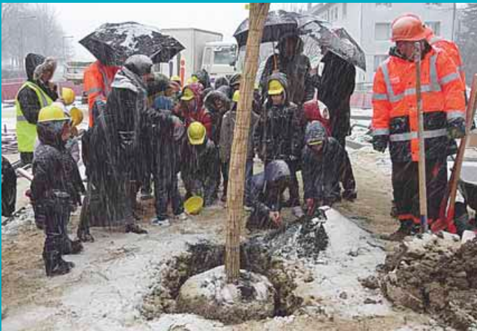
Février 2013: plantation du premier arbre rue des Cras.