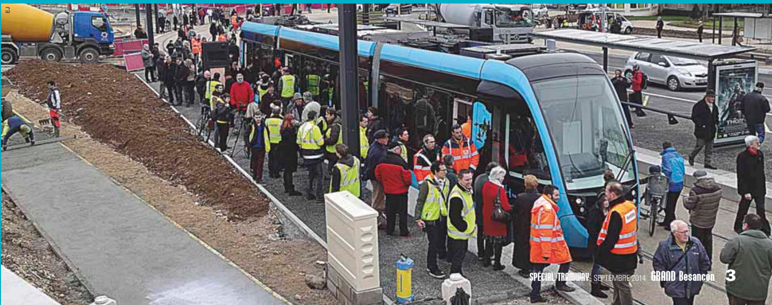
15 janvier 2014: le tram traverse le centre-ville et arrive pour la première fois à la gare Viotte.