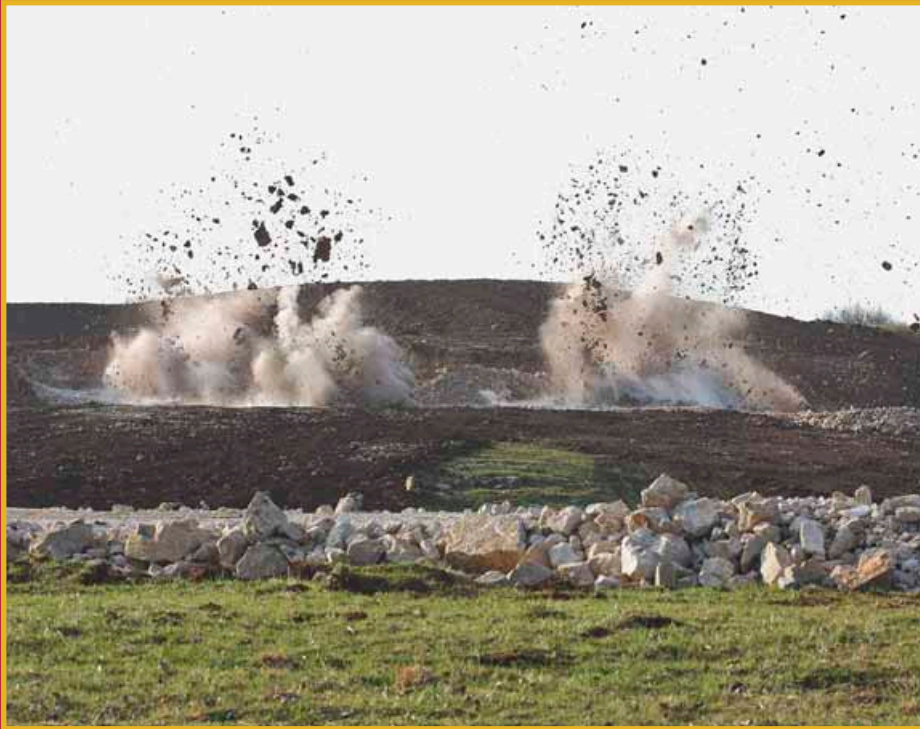
Janvier 2012 : tir de mines pour terrasser le terrain du centre de maintenance.

Pour construire 14,5 km d'infrastructure, un Centre de Maintenance de 6500 m 2 , un encorbellement en bois long de 300 m, suspendu au-dessus du Doubs, et le nouveau pont Battant de 24 m de large, de nombreux fronts de chantier ont simultanément été conduits pour assurer une ouverture au public en septembre 2014. Près de 600 ouvriers par jour en moyenne ont travaillé pendant 2 ans et demi sur le chantier.