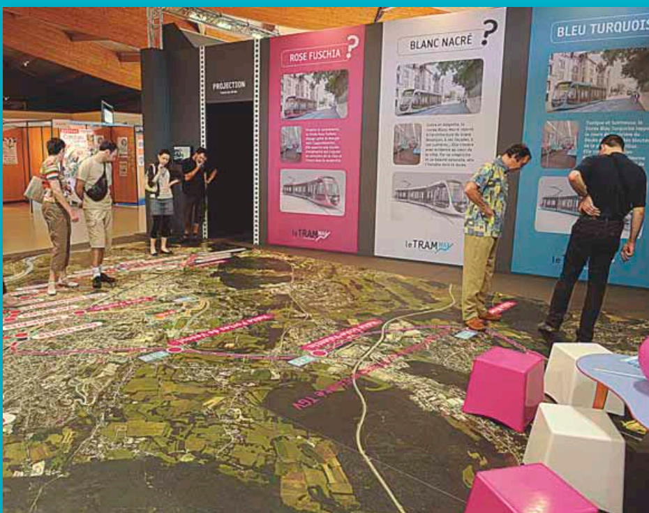
Avril 2011: choix de la couleur du tram sur le stand du projet à la Foire Comtoise.