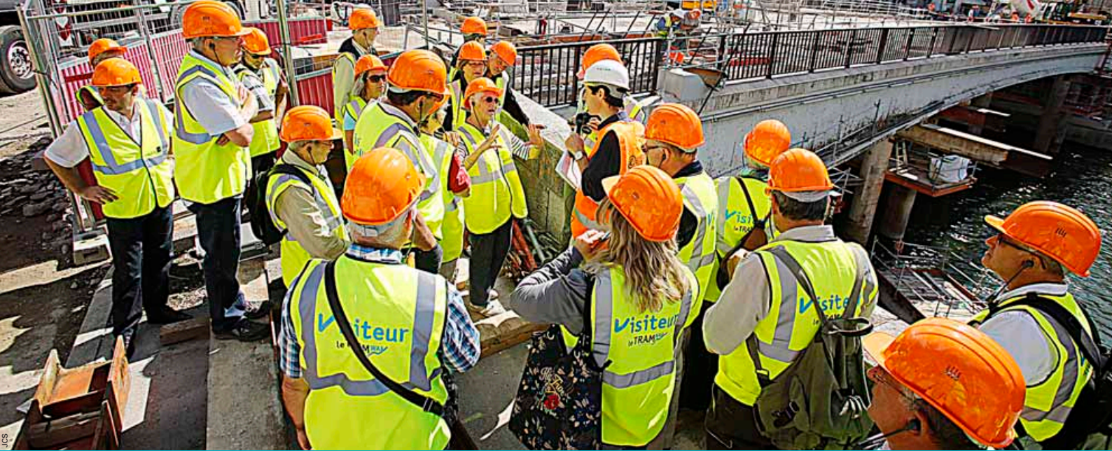
Juin 2012: visite de chantier ouverte au public sur le Pont Battant et le Quai Veil Picard.