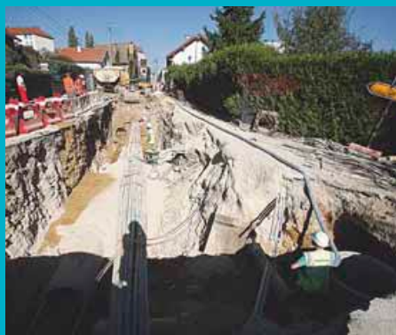
Octobre 2011: début des travaux de dévoiement de réseaux.