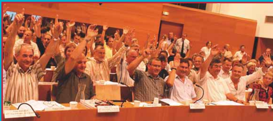
30 juin 2010: vote du projet par le Conseil communautaire du Grand Besançon.

Entre le vote du projet par les élus du Grand Besançon le 30 juin 2010, et les premiers essais du tramway le 16 septembre 2013, il aura fallu 3 ans pour mener à bien les grandes étapes administratives et techniques de la construction de la 1 ère ligne de Tramway.