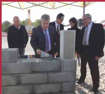
27 septembre 2012 : pose de la première pierre du centre de maintenance.