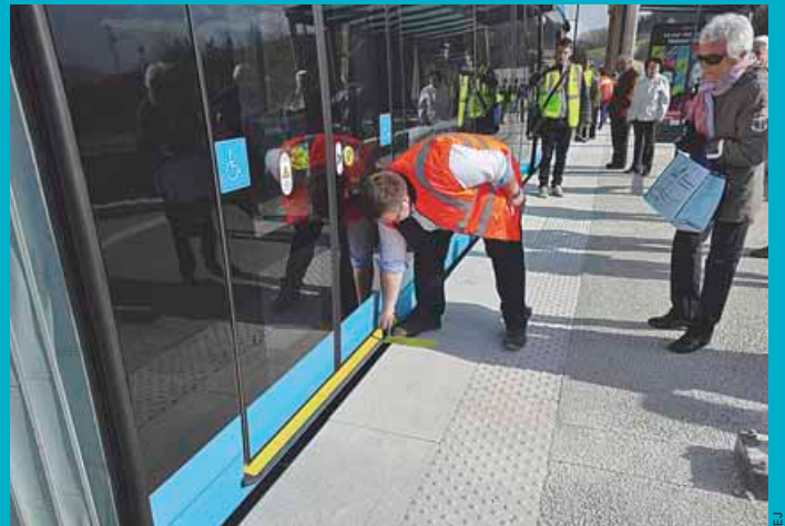
30 avril 2014: le tram est testé sur la partie est du tracé, jusqu'à Chalezeule.